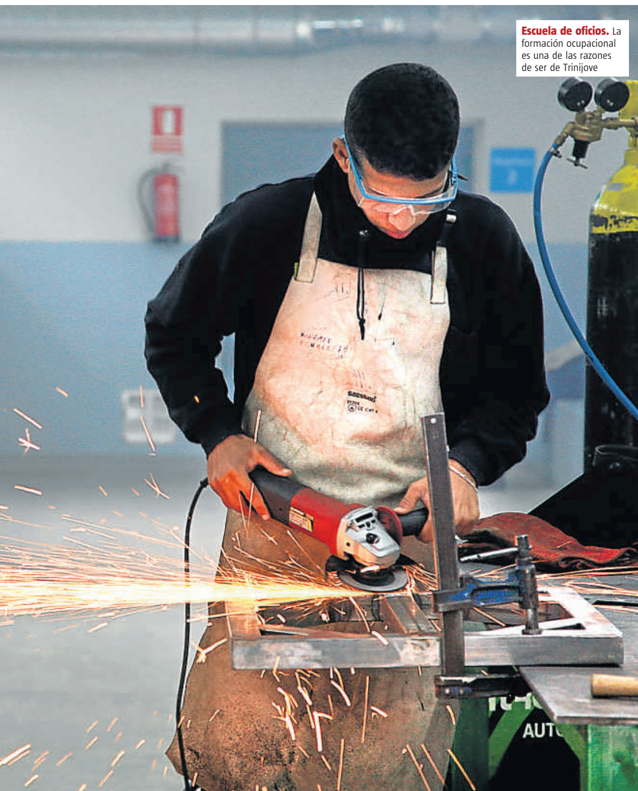
Escuela de oficios. La formación ocupacional es una de las razones de ser de Trinijove